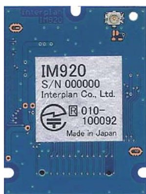
外部アンテナタイプ