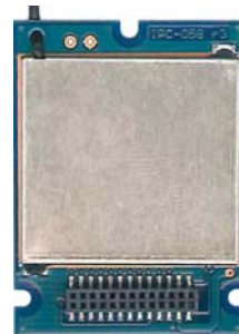
送受信モジュール IM315TRX