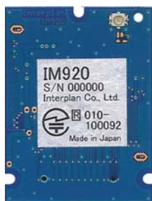
外部アンテナタイプ IM920XT