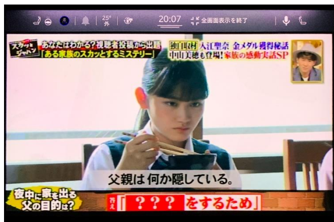
図1. 停車時のTV視聴画面

コマンダーとコンパスは、ナビキャンセルせずにTVだけ単独での視聴制限の解除が可能です。