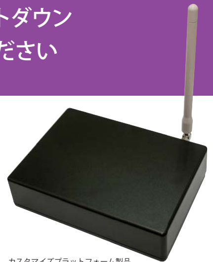
カスタマイズプラットフォーム製品